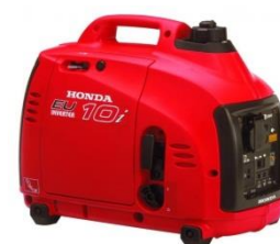
Groupe Honda EU10i – 1000 W